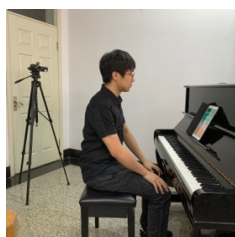
（Pad“腾讯QQ”置于谱台用于接收试题，手机“腾讯会议”用于收听指令与演唱）