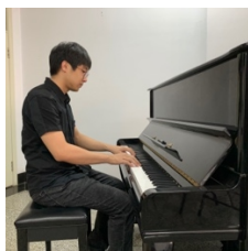
（钢琴演奏：须看到琴键、双手与侧脸）

1、作曲、录音艺术专业面试画面示意图：手机“腾讯会议”、手机支架，所有设备不能移动。