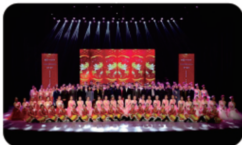
沈阳音乐学院建校80周年系列音乐会—继续教育学院专场音乐会