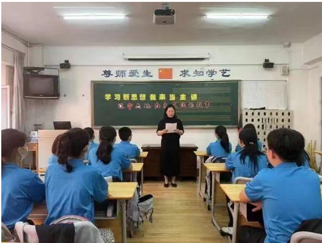
图 5 学习新思想 我来当主讲”主题班会