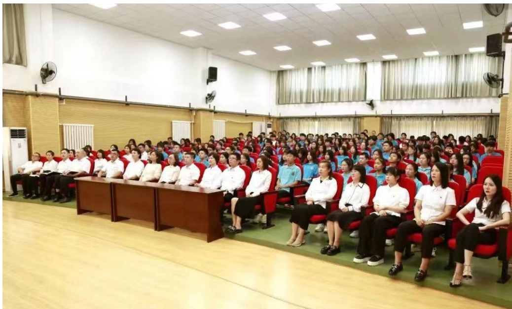
图 2 师生观看开学第一课