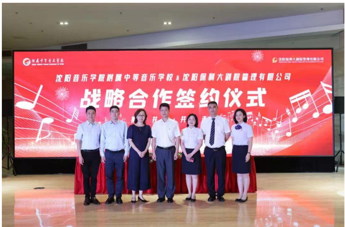
图 25 与盛京大剧院签约仪式