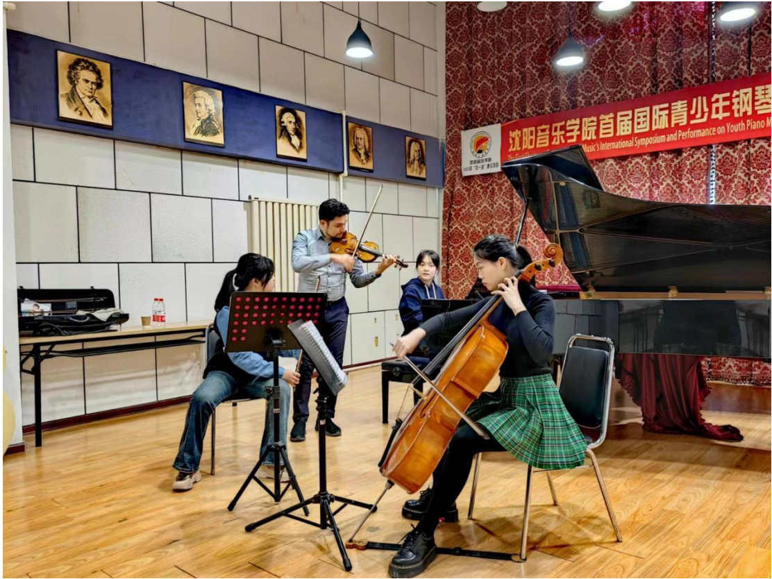
图 22 德国法兰克福音乐与表演艺术学院小提琴专家大师班