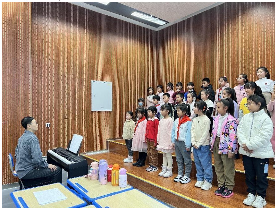
图 17 合唱课排练

沈音附中与 126 中学浑南分校，创新一校小学进行对接活动，目前开展合唱排演活动，于每周三派出教师到以上两个学校进行合唱排练。