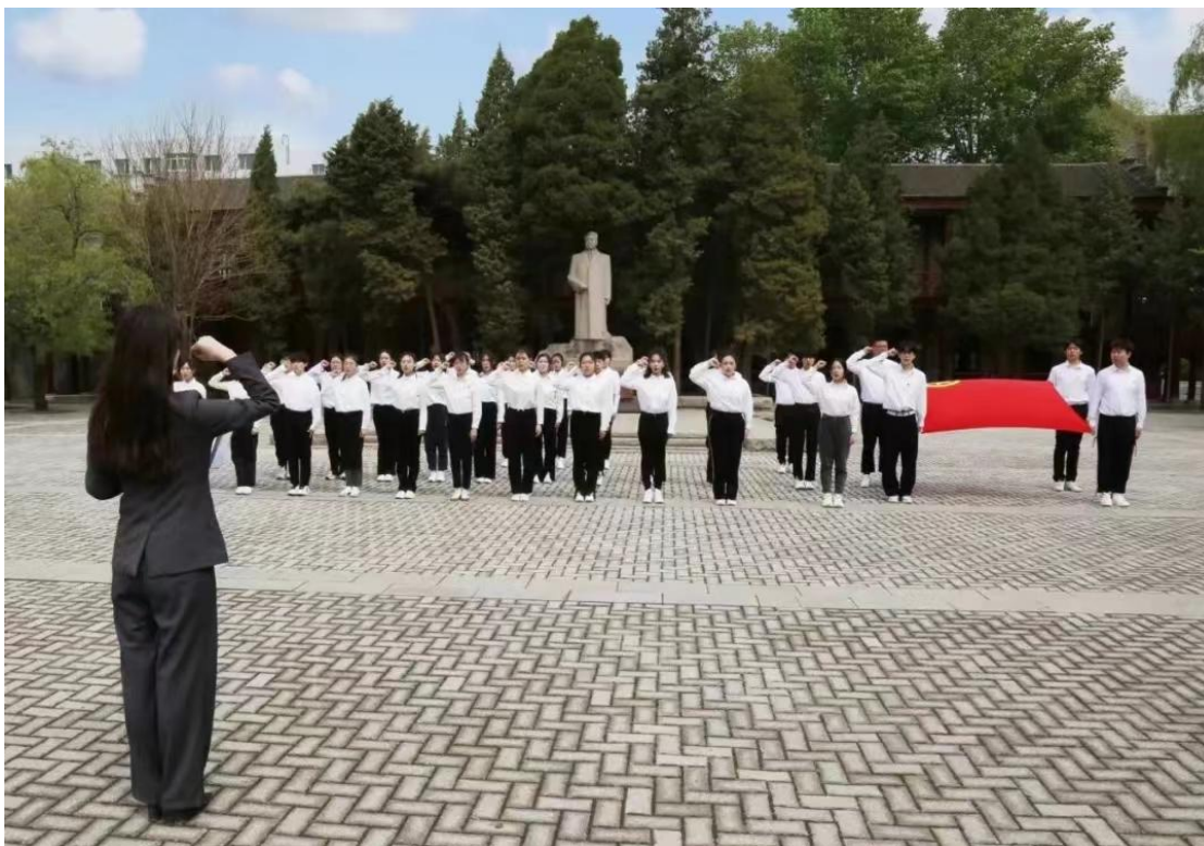
图 8 新团员入团仪式

面对新的挑战 and 机遇，学校在德育工作上始终秉持创新原则，努力探索与实践新的教育方法和理念。我们致力于维护稳定的教育教学秩序，促