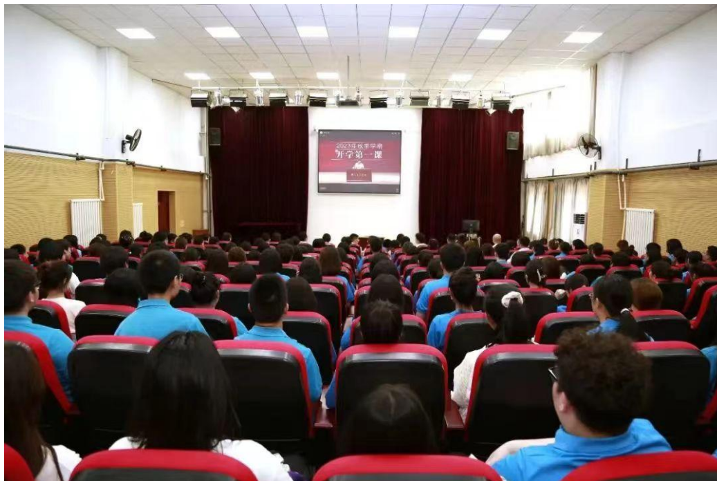
图 1 师生观看“开学第一课”

为认真贯彻落实党的二十大精神，深入开展学习贯彻习近平新时代中国特色社会主义思想主题教育，全面贯彻党的教育方针，落实立德树人根本任务。按照学院党委部署，9月6日，附属中等音乐学校党总支组织全校党员、干部、师生100余人收看学院党委书记赵恒心作的题为“赓续红色血脉、做‘强国复兴有我’的鲁艺传人”的“开学第一课”。“开学第一课”后，附属中等音乐学校党总支组织领导干部、党员、教师召开座谈会。以班级为单位，班主任同步组织召开交流会。全校师生热议赵书记讲话精神。