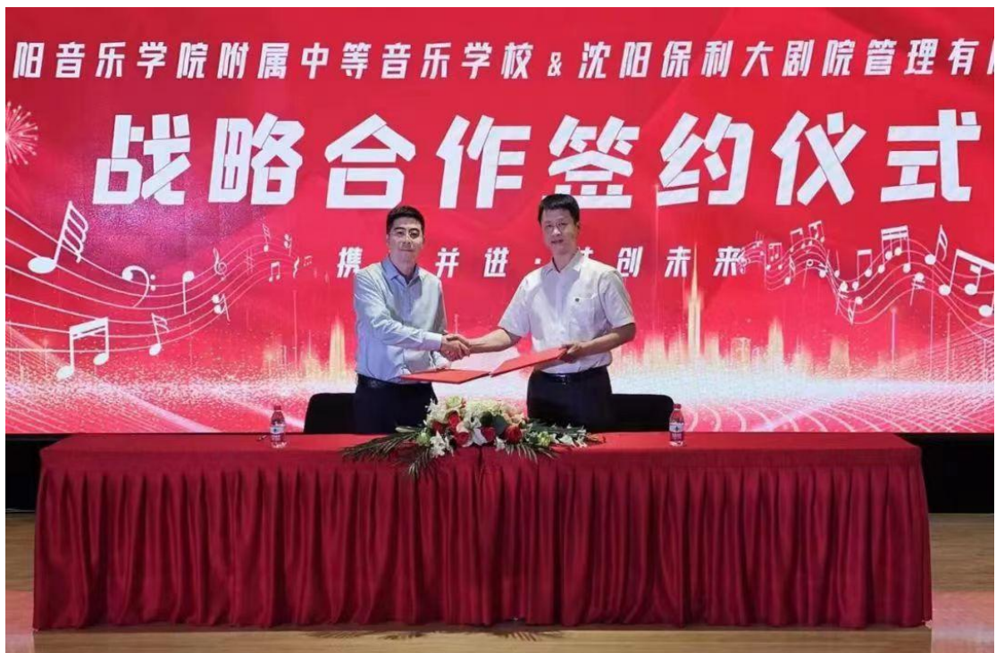
图 24 与盛京大剧院签约仪式