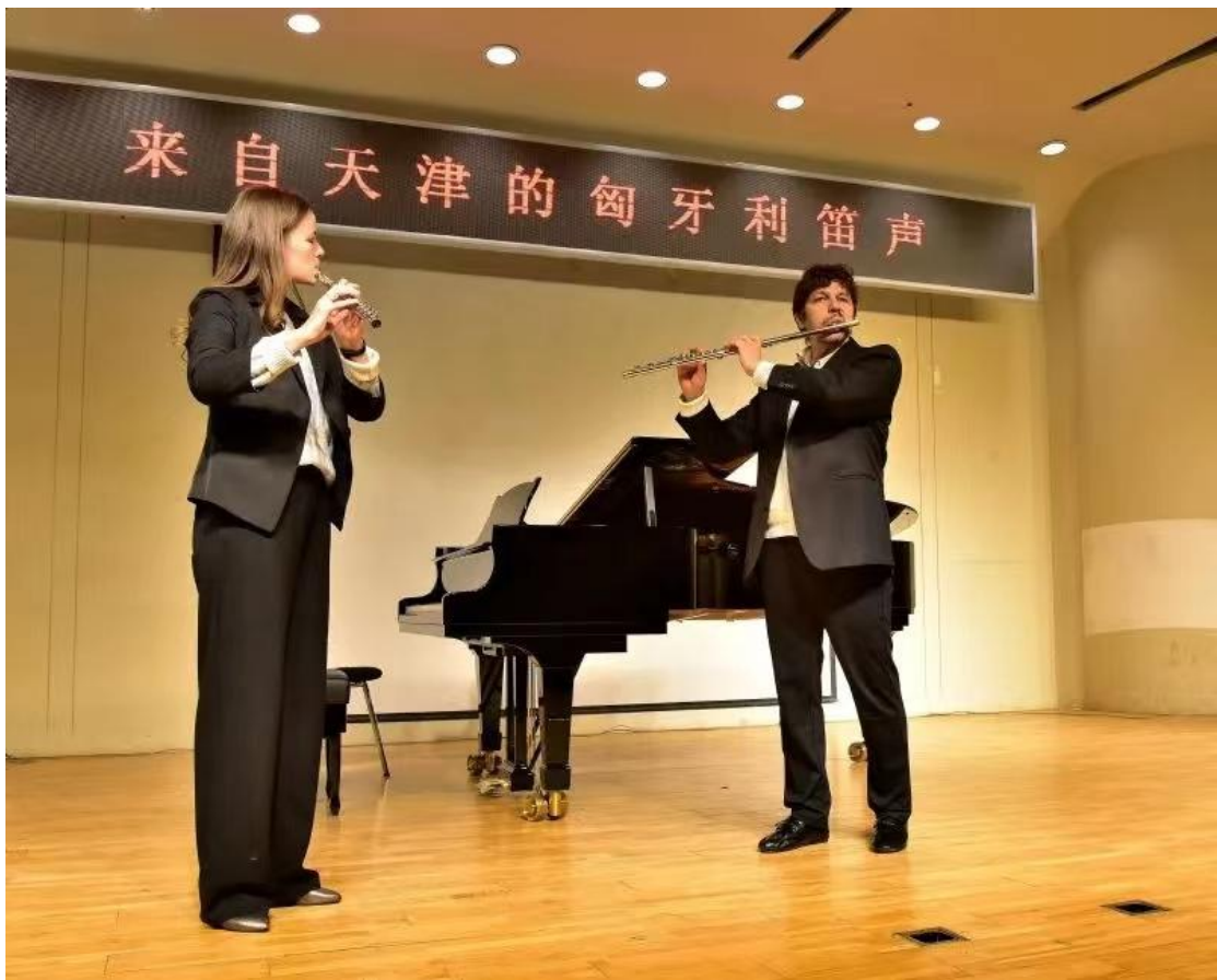
图 23 盖伊·伊采什音乐会展示