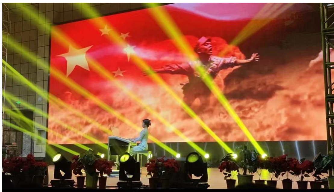
图 15 拥军演出

在八一建军节某部队文艺汇演中，学校派出双排键教师参加演出，并演奏《黄河》钢琴协奏曲。