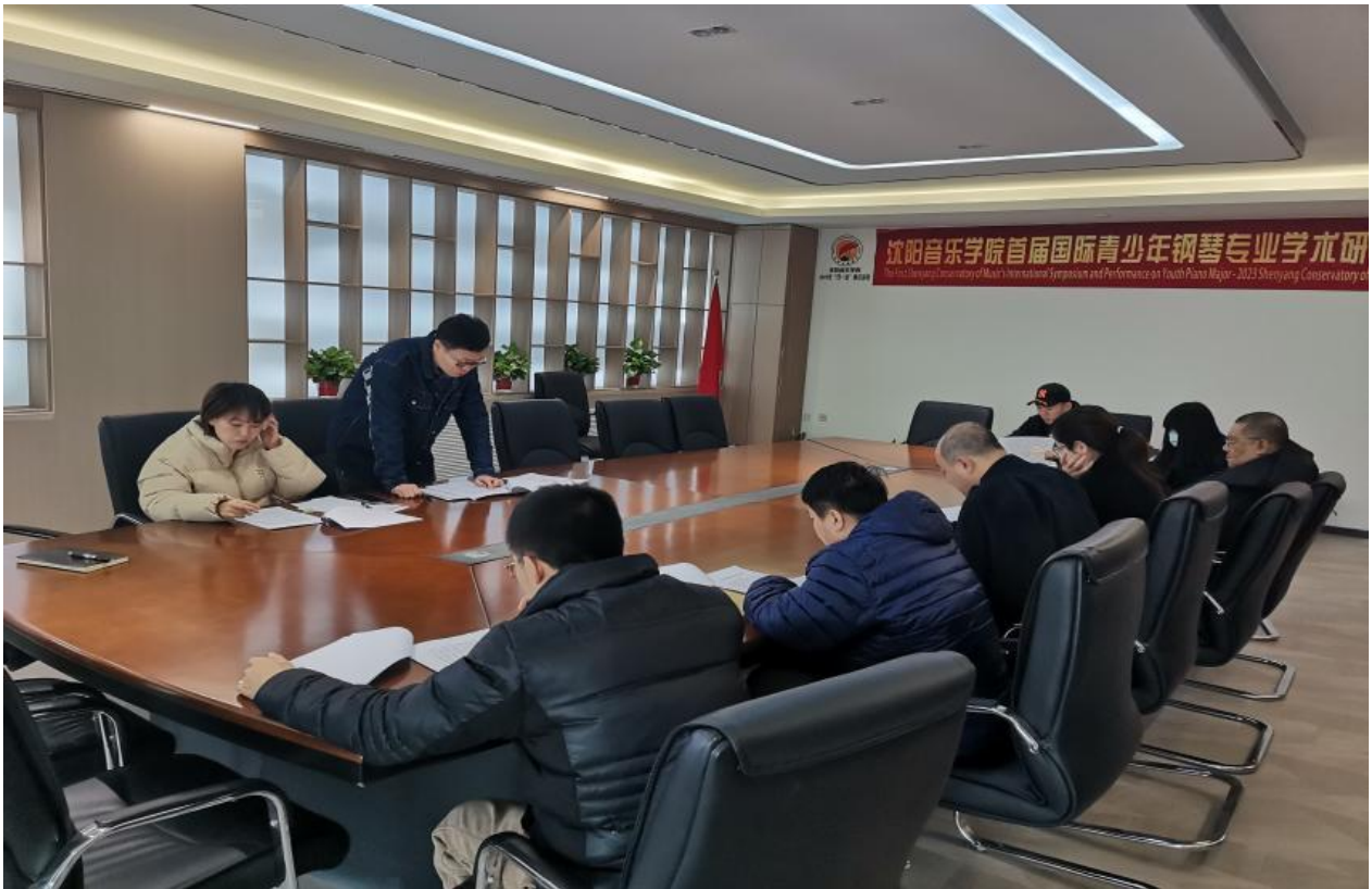
图 14 教材使用委员会研讨