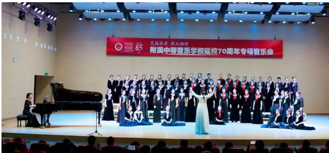
图 19 建校 70 周年专场音乐会