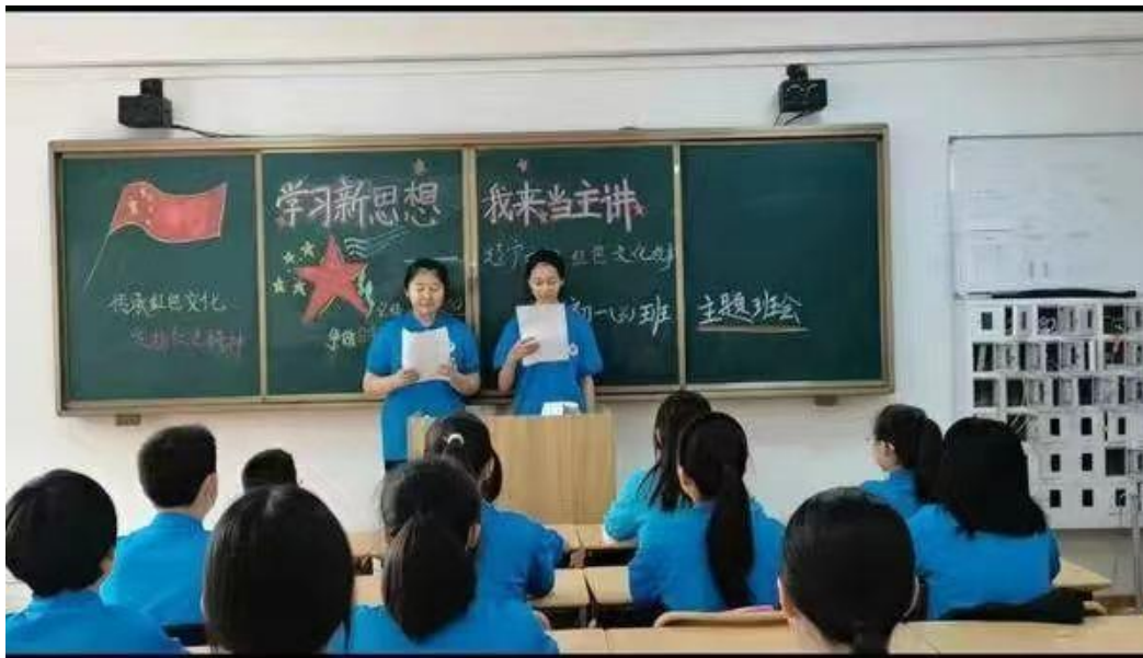
图 6 学习新思想 我来当主讲”主题班会

深入开展心理健康教育。学校已经加强了对学生心理健康教育的关注，采用心理健康讲座、板报及多媒体宣传等多种形式，确保心理健康教育能够全方位、多渠道地渗透到校园的每个角落。班主任们不仅参与了上级部门提供的专业心理健康教育课程培训，还提升了自身心理健康教育能力，使他们能更敏锐地察觉到学生的心理健康问题。一旦发现有学生存在心理