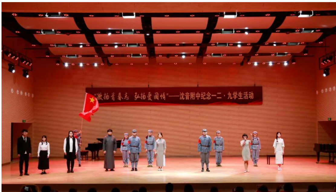
图 21 “激扬青春志 弘扬爱国情”--纪念一二·九运动学生活动