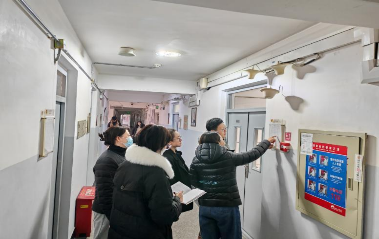
图 12 督导组查课

现问题及时解决问题。每学期开学初对教师的各项教学材料进行检查，学校督导组对于各项课程以及考试随时进行抽查等，了解教学情况，发现问题，提出意见，为改进教学管理、教学效果提供依据，将课程监控贯穿于课内课外各个环节。学校定期对学生进行问卷调查，调查教学方法、教学相关内容、课堂秩序、教学态度等方面，用以改进工作，提高教学质量。