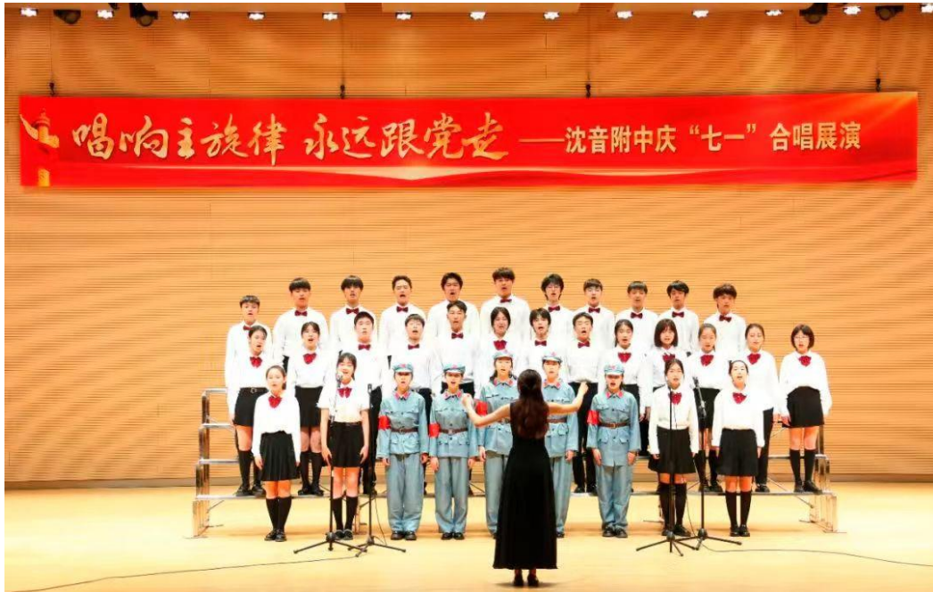
图 3 合唱展演活动现场