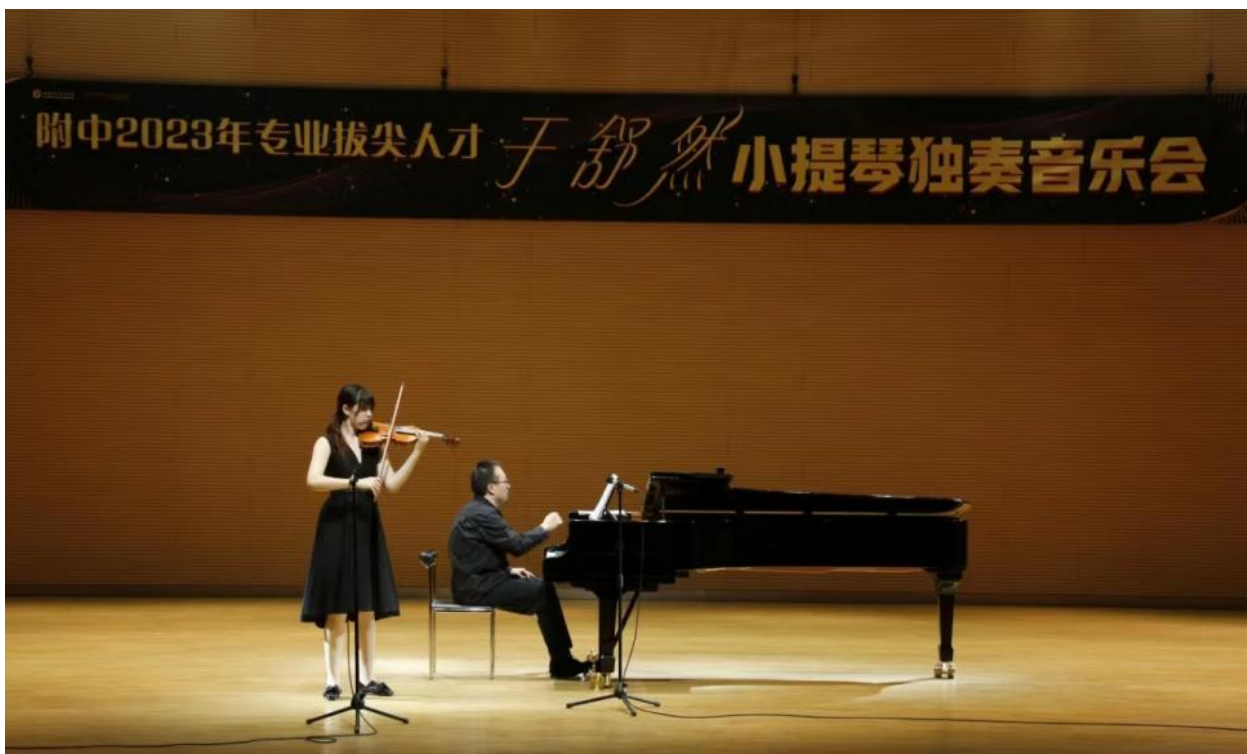
图 9 拔尖人才音乐会