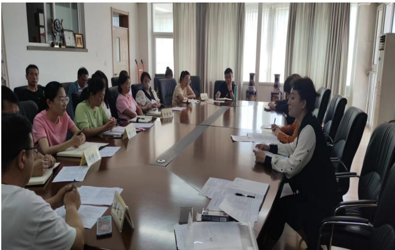
图 11 艺术类高考新形势下教学研讨

课程设置要与人才培养目标、定位相适应，要主动适应音乐专业发展需要。深化教学内容改革，优化课程体系，提升课程建设水平。在教学实践过程中，将新知识、新理论和新技术等新内容及时充实到教学过程中，及时淘汰陈旧的教学内容，保持课程旺盛的生命力，从而达到优化学科专业，提高教学质量的目的。沈音附中在认真总结课程教学改革经验基础上，在公共基础学科设立六个教研组，根据艺术类高考分别对公共基础课程教学大纲进行修订；组织公共基础课教师学习、研究和实施教学大纲，积极总结教学改革的经验，及时组织开展师资培训和教研活动，促进教师转变教育教学观念，设置课程教学目标和调整教学内容结构，提高教师教学能力和文化素养。