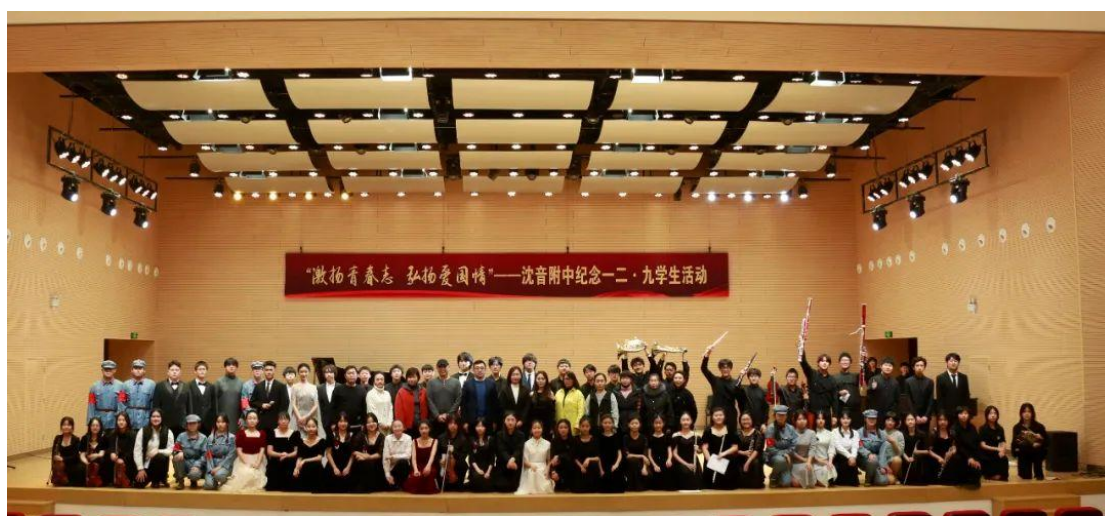
图 20 “激扬青春志 弘扬爱国情”——纪念一二·九运动学生活动

附属中等音乐学校举行“激扬青春志 弘扬爱国情”——纪念一二·九运动学生活动。此次活动共分为“烽火岁月”、“新生曙光”、“走进新时代”、“时代华章”、“共筑梦想”五个篇章，通过多种演出形式展现了我国不同历史时期的精神风貌和时代特征，激发了学生们的爱国情感，增强了学生们的舞台实践能力。