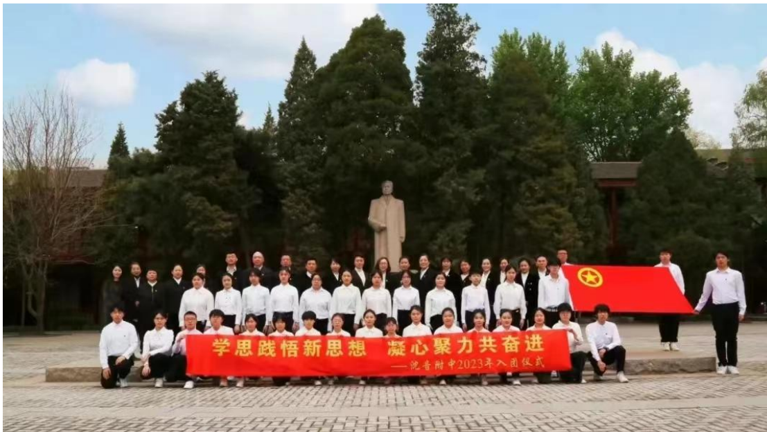
图 7 新团员入团仪式

鲁艺传人；四是要以入团为起点，发挥模范带头作用，团结带领同学凝聚爱校、爱家、爱人民的强大合力，用青春和汗水谱写中华民族伟大复兴的中国梦。