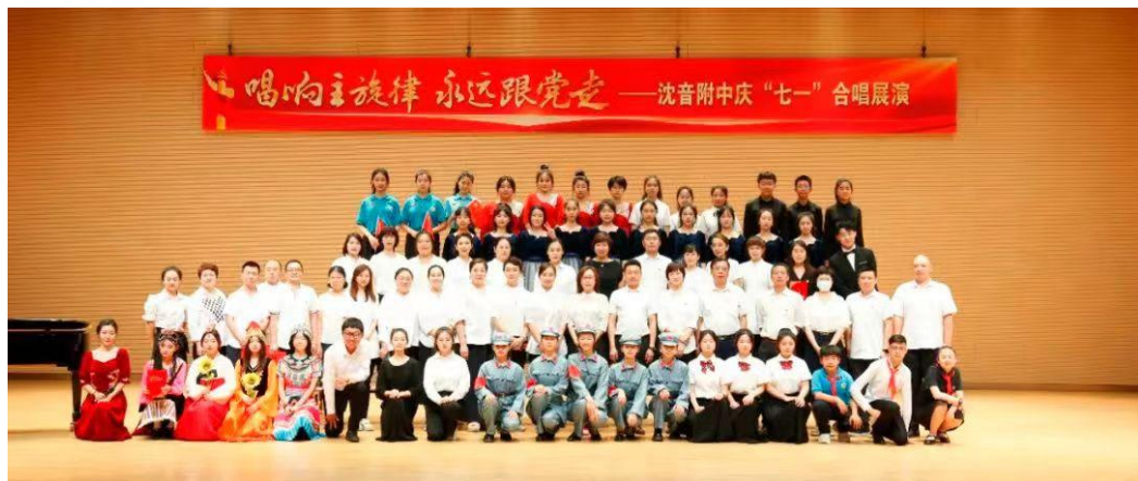
图 4 合唱展演活动学校领导与参演师生合影

此外，学校还举办了内容丰富的主题班会，比如3月6日举行“开学第一课”之健康与安全主题班会；3月17日举行法制教育主题班会，学习《中小学教育惩戒规则》和《预防未成年人犯罪法》；3月27日组织召开“深入学习‘开学第一课’”主题班会；4月下旬举行深刻领悟习近平新时代中国特色社会主义思想的真理力量和实践伟力——学风建设主题班会；5月下旬组织召开“学习新思想 我来当主讲”——辽宁“六地”红色文化的故事主题班会；7月10日召开期末安全教育主题班会；9月1日召开“开学安全和纪律教育”主题班会；9月27日召开国庆节假期安全教育主题班会；10月下旬举行“讲廉洁故事，做廉洁少年”——廉洁教育主题班会；11月下旬举行“说文明话，做文明人，建文明校园”主题班会；12月下旬举行期