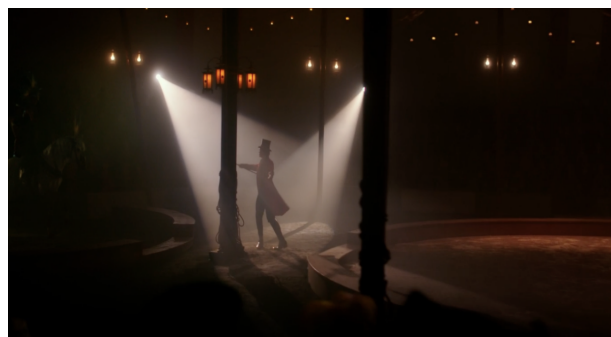
图2 影片中的穿梭视角

词“ It's a preacher in the pulpit and you'll find devotion ”（这是讲坛上的布道者，你将在此找到虔诚），则将P. T. 巴纳姆的入场仪式化为一场走向圣坛的加冕。观众被置于一个既跟随又超越的特殊位置，见证着这位最伟大的表演家如何创造他的世界。最终，当P. T. 巴纳姆站立在聚光灯下的舞台中央时，这个由穿梭镜头引导的画面（见图2）。